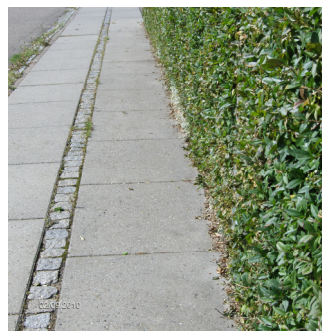
Ud over skel