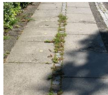
For meget ukrudt