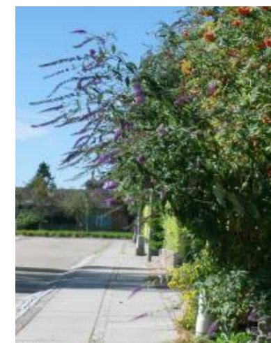
Busk ud over fortovet